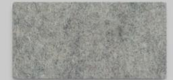
07 HELLMELIERT 07 LIGHT GREY MIXTURE