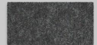
08 GRAPHIT 08 GRAPHITE

ALLE FARBEN SIND IN DEN MATERIALSTÄRKEN 2 MM, 3 MM UND 5 MM LIEFERBAR. DIE MATERIALSTÄRKE 8 MM IST NUN IN DEN FARBEN 01, 02, 07, 11 UND 27 ERHÄLTICH.