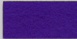
13 VIOLETT 13 VIOLET