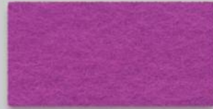
37 ROSA 37 ROSE