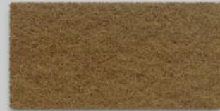
28 MOCCA 28 MOCCA