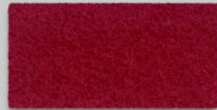
11 ROT 11 RED