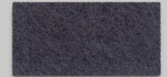
17 TAUBENGRAU 17 DOVE GREY