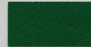
44 TANNENGRÜN 44 FIR GREEN