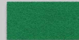
40 KLEEGRÜN 40 CLOVER GREEN