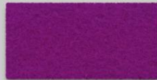
32 PINK 32 PINK