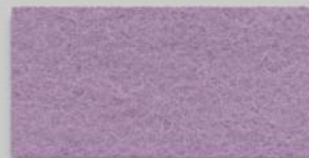
61 MALVE 61 MAUVE