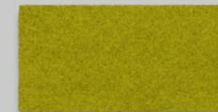
25 VERDE 25 VERDE