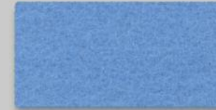
33 HIMMEL 33 SKY BLUE