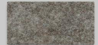
09 BRAUNMELIERT 09 LIGHT BROWN MIXTURE