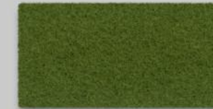
24 OLIV 24 OLIVE