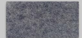
01 ANTHRAZIT 01 ANTHRACITE