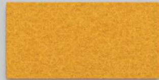
05 ORANGE 05 ORANGE