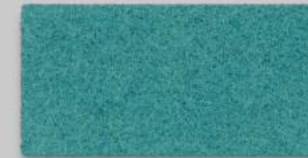
14 TÜRKIS 14 TURQUOISE