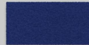
18 DUNKELBLAU 18 DARK BLUE