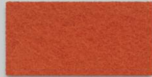
20 MANGO 20 MANGO