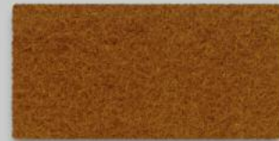
29 WALNUSS 29 WALNUT