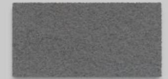
16 HELLGRAU 16 LIGHT GREY