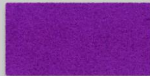
22 FLIEDER 22 LILAC