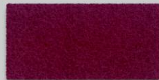
21 BORDEAUX 21 BURGUNDY