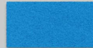
34 PETROL 34 PETROL