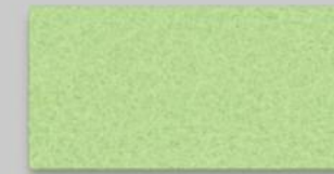
65 LEMON 65 LEMON