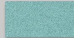
64 PASTELLTÜRKIS 64 PASTEL TURQUOISE