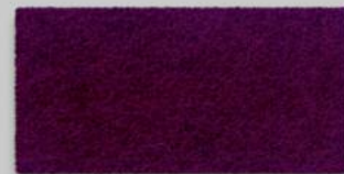
26 AUBERGINE 26 AUBERGINE