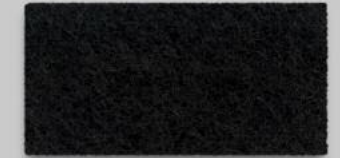
02 SCHWARZ 02 BLACK