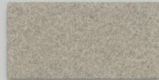
36 STONE 36 STONE