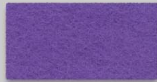
31 LAVENDEL 31 LAVENDER