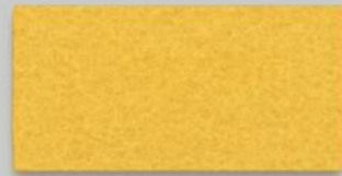
15 GELB 15 YELLOW