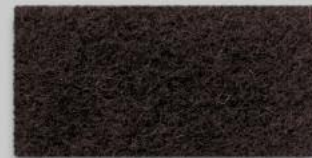
27 SCHOKO 27 CHOCOLATE