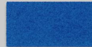
10 BLAU 10 BLUE