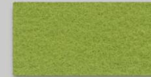
30 MAIGRÜN 30 MAY GREEN