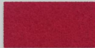
55 MOHNROT 55 POPPY RED