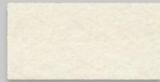
03 WOLLWEISS 03 WOOL WHITE